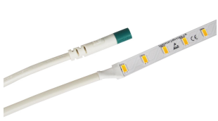
AKKO LED Verbinder TW/RGB IPxx