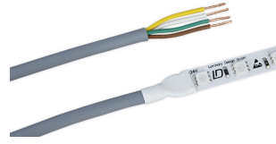
Kabel RGB IPxx