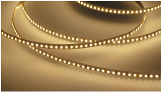
Superschmaler LED Strip+ 12W/m