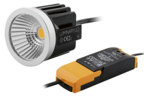
INIX LED Modul Set 4,5W