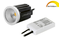
INIX DALI DTW Set 12W