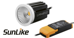
INIX SunLike LED Modul Set 12W