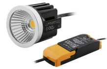
INIX LED Modul Set 6W