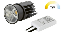
INIX DALI TunableWhite LED Modul Set 10,5W