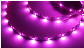
RGB LED Strip 7W/m