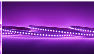
RGB LED Strip 25W/m