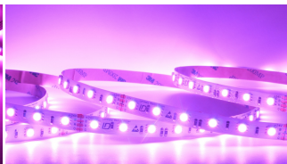
RGB LED Strip 15W/m