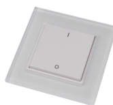
1 Kanal Glastaster