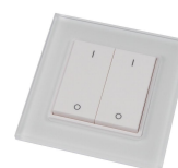
2 Kanal Glastaster