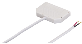
MIBA 6-fach Verteiler